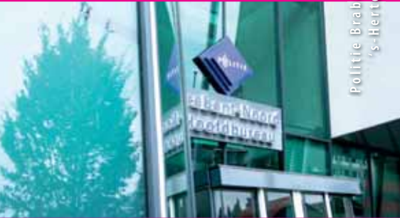
Politie Brabant-Noord 's-Hertogenbosch