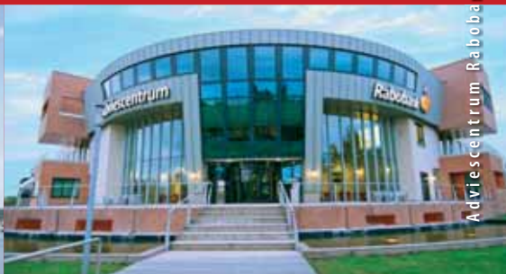
Adviescentrum Rabobank Heesch