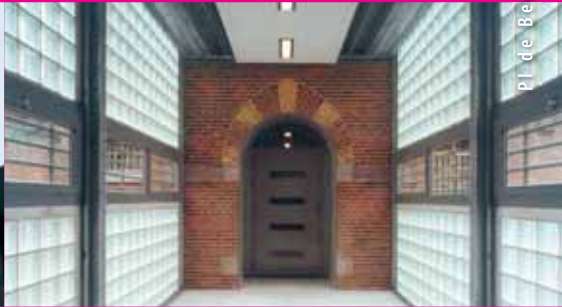
PL de Berg Arnhem