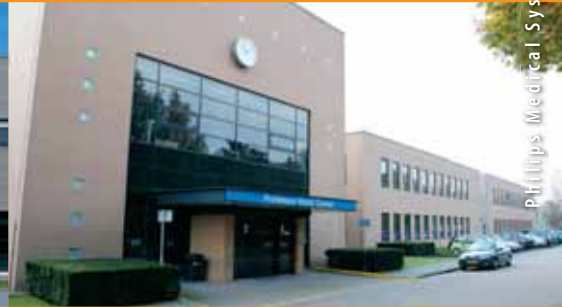
Philips Medical Systems Best