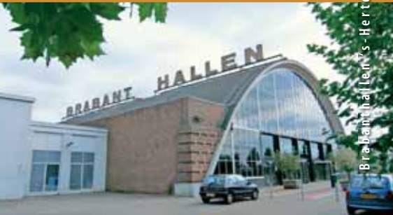
Brabant hallen - Hertogenbosch