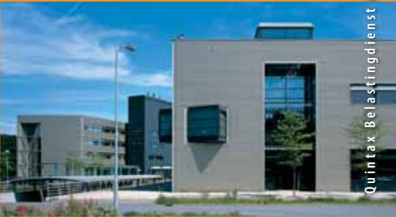
Quintax Belastingdienst Apeldoorn