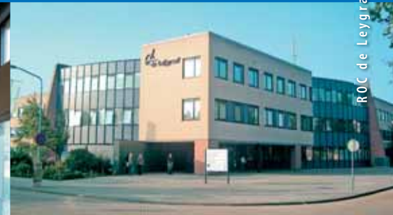
ROC de Leygraaf Veghel