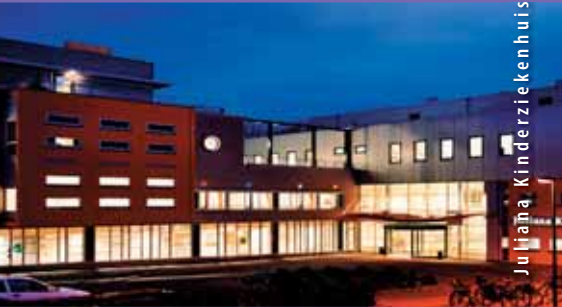
Juliana Kinderziekenhuis Den Haag