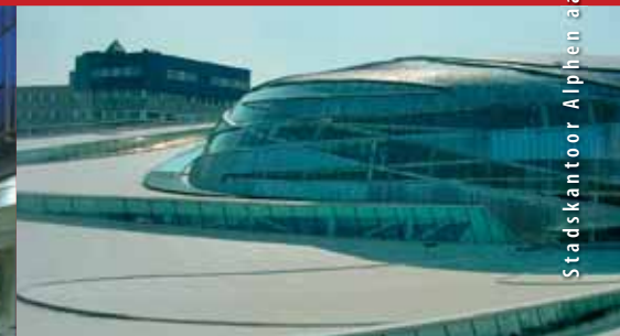
Stadskantoor Alphen aan de Rijn