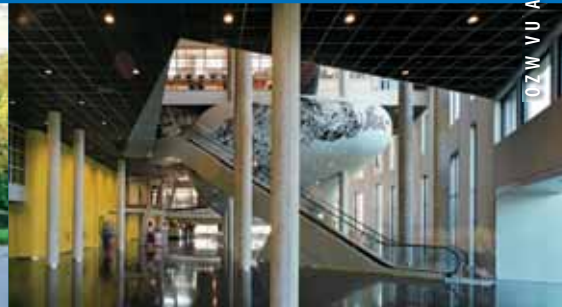
OZW VU Amsterdam