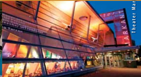
Theater Markant Uden