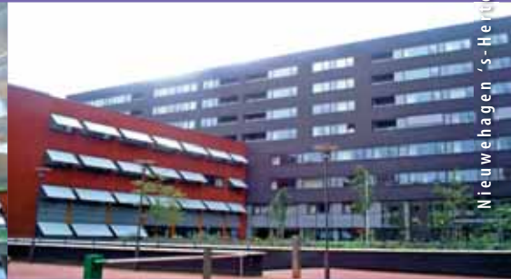
Nieuwe hagen 's-Heugenvosch