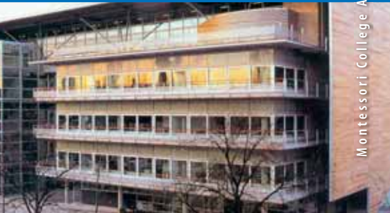
Montessori College Amsterdam