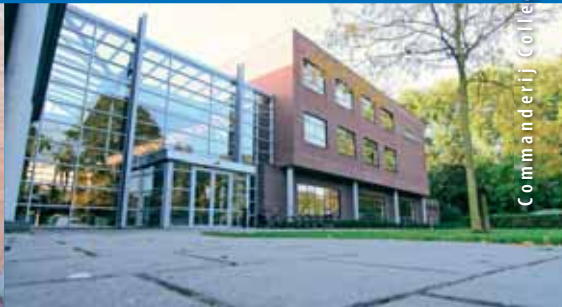
Commanderie College Gemert