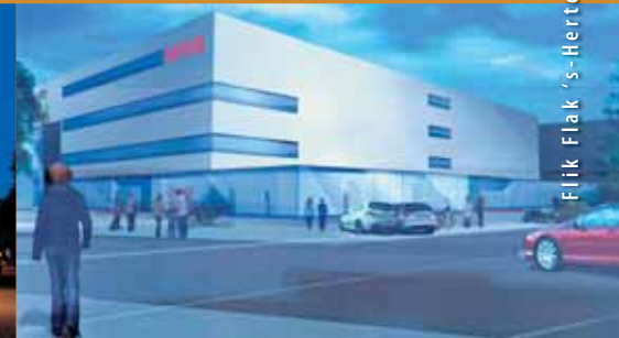
Flik Flak 's-Hertogenbosch