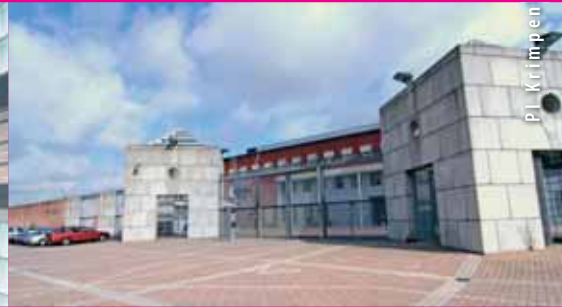
PL Krimpden a/d IJssel